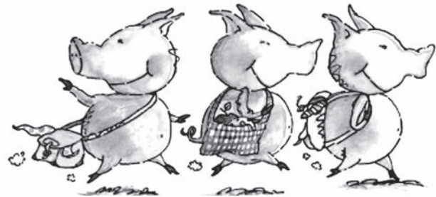
Illustration : Marie-Louise Gay ( Les trois petits cochons )